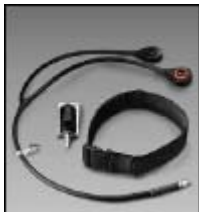
Equipo de Suministro de Aire SA-2000 con Aprobación NIOSH